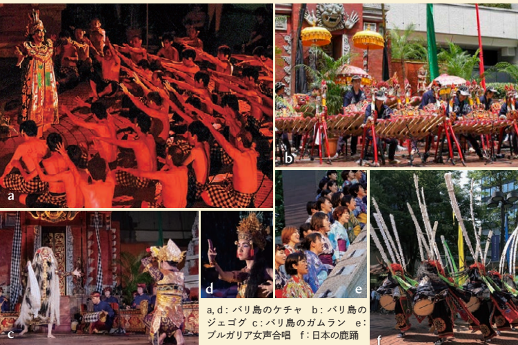
a, d: バリ島のケチャ b: バリ島のジェゴグ c: バリ島のガムラン e: ブルガリア女声合唱 f: 日本の鹿踊

World Performances - Enjoy the finest performing arts