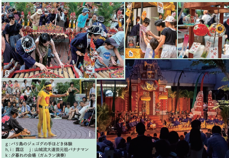
g: バリ島のジェゴグの手ほどき体験 h, i: 露店 j: 山城流大道芸元祖バナナマン k: 夕暮れの会場 (ガムラン演奏)

The real appeal of Cak Festival is the "joy of creating together" that is common to festivals around the world with long traditions. Those who visit the place will enjoy the sound of rare musical instruments by touching them, make fun of festival shops, and even jump in on the street performances. Application for "Matsuri Nakama" (festival mates), who make good sweat in sharing festival building, is more than welcome!